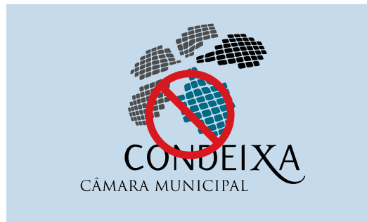
Alterar as proporções dos elementos