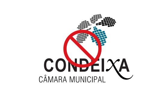
Alterar a tipografia definida