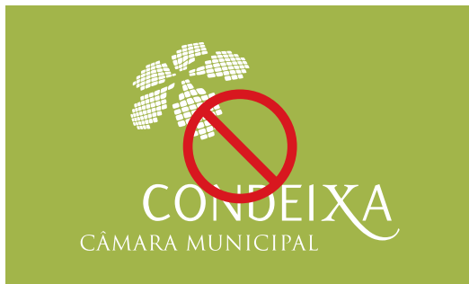
Mudar a disposição da logomarca