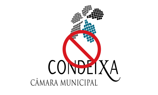
Aumentar desproporcionadamente a marca