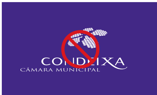
Encolher desproporcionadamente a marca