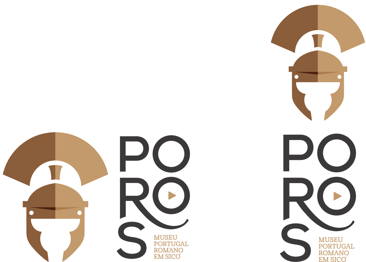
VERSÃO SECUNDÁRIA HORIZONTAL E VERTICAL