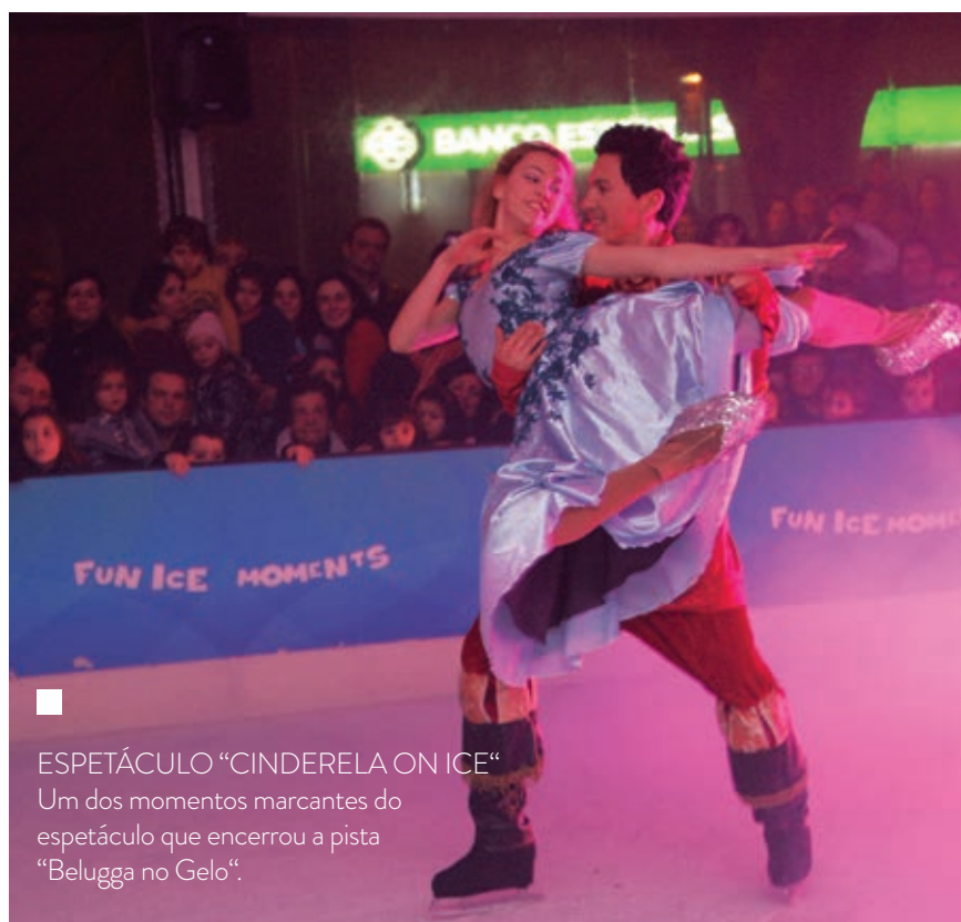
ESPETÁCULO "CINDERELA ON ICE" Um dos momentos marcantes do espetáculo que encerrou a pista "Belugga no Gelo".

A pista de gelo instalada na época natalícia em Condeixa-a-Nova, por iniciativa da Câmara Municipal tornou-se um atrativo diferenciador na promoção do centro histórico da vila de Condeixa e, consequentemente, do comércio tradicional.